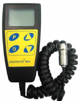
Рисунок 1 Толщиномер индукционный Константа МК4

Внешний вид прибора приведен на рисунке 1.